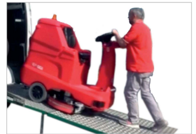
Sistema de conducción a distancia que facilita la carga y descarga de la maquina.