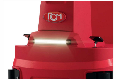
Luces LED incorporadas que garantizan una mayor seguridad y mejor resultado de limpieza