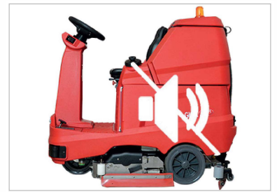
Motor aspiración silencioso Supersilent