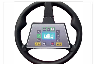
La ubicación de todos los comandos en el volante facilita y simplifica el uso de la fregadora